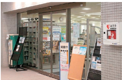
鶴岡記念図書館出入口に設置されたAED