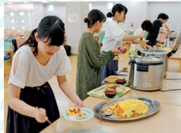
7月のイベントは、カレー・オムライス・チャーハンの「米米祭」

朝ごはんの大切さを伝えようとスタートした後援会助成による食育プログラム『100円朝食』は、今年で4年目となります。1食300円のうち、100円を学生が負担し、200円を後援会が助成しています。たくさんの学生に利用してもらおうと、趣向を凝らしたイベント(バイキング等)を毎月実施し、利用を呼びかけています。