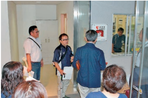
本館1階 警備室前に設置されたAED

用改善に力を入れていただく大学の姿勢の賜物です。また後援会協力の空調設備も貢献していることは間違いのない事実です。 そして今回のメインの確認は、昨年度後援会の提案で今年度実施されたAEDの設置です。広い敷地内でもしもの時に命を救うため増設したAEDを確認致しました。AEDが使われることがないのが一番ですが、学生・教職員に設置場所を覚えていただきたいと思えます。 夜間の照明はまだ完全に暗くなる前でしたが、ライトがLEDになり比較的明るく感じました。 二時間程の見学を終え、参加者で感想や問題点などを話し合い、今後の活動に活かせるよう確認し全行程を終了致しました。 会員の皆様には、後援会の事業に是非関心を持っていただけたら幸いです。 最後になりますが、キャンパスウォッチングにあたり、事務局の皆様のお陰で大変スムーズに進められたこと、後援会を代表して感謝を申し上げます。