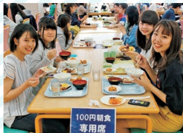
5月のイベントはバイキング。100食が即完売です

後期営業は10月1日(月)から。前期営業とあわせ年100日間の営業を目指します。メニュー表(アレルギー・カロリー)や過去のメニュー写真は、本学HPの「PICK UP」で確認できます。ちなみに前期の一番人気メニュー(イベントメニューを除く)は、5月29日(火)の煮込みハンバーグ、かぼちゃサラダでした。