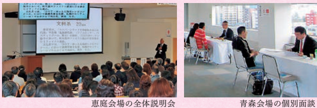
恵庭会場の全体説明会

【内容】全体説明、学科別説明、個別面談(希望者) 父母懇談会の詳細は、本学HP「PICK UP」をご覧ください。 ※地方会場:昨年度は青森市、函館市。来年は帯広市、釧路市を予定。