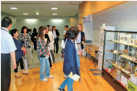
「100円朝食」の会場である学生食堂を見学