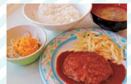
89人が利用しました