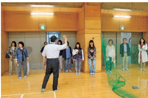
体育館でサークル活動を見学