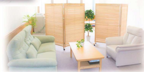
保健管理センター